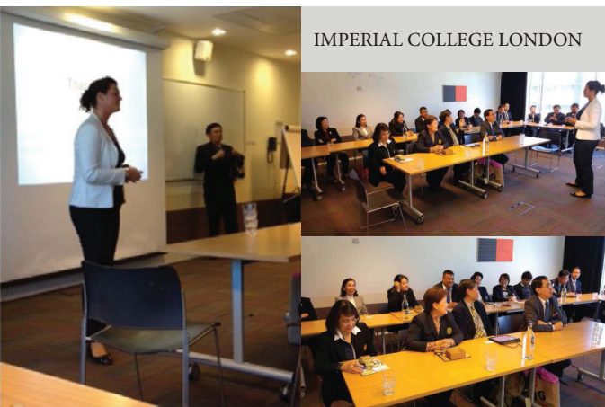
IMPERIAL COLLEGE LONDON

โครงการเจรจาความร่วมมือทางวิชาการบัณฑิตศึกษา ณ ต่างประเทศ ในสหราชอาณาจักรซึ่งมุ่งเน้นความเป็นเลิศในด้านบัณฑิตศึกษา ระหว่างวันที่ 1-8 พฤษภาคม 2559