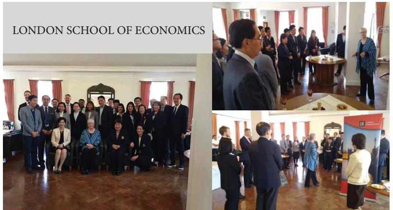
LONDON SCHOOL OF ECONOMICS