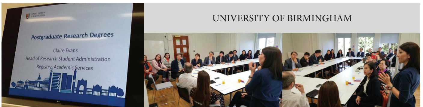
UNIVERSITY OF BIRMINGHAM