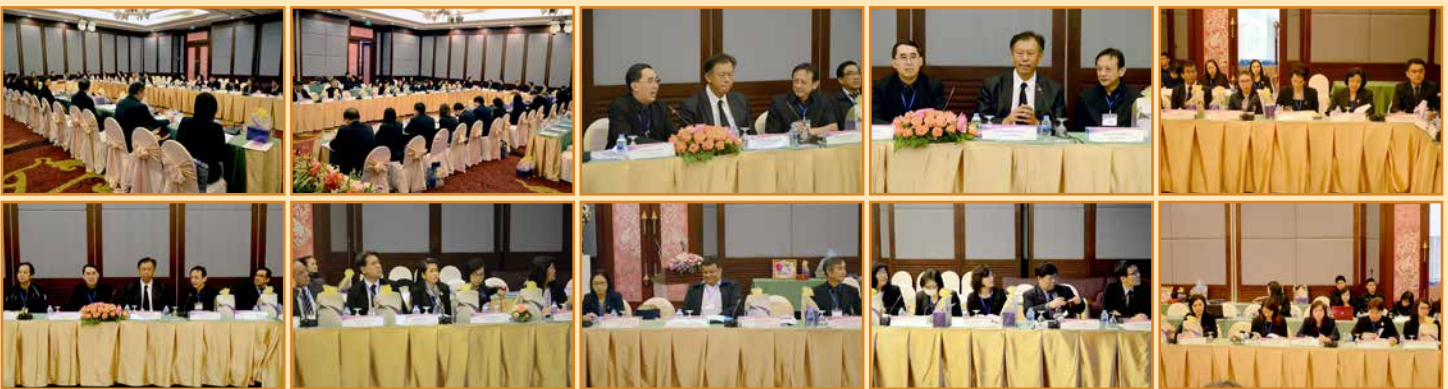
บรรยากาศการประชุมคณะผู้บริหารบัณฑิตศึกษา มหาวิทยาลัยของรัฐและมหาวิทยาลัยในกำกับของรัฐ (ทคปร.)