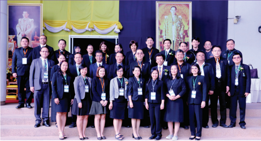
คณะผู้บริหารบัณฑิตศึกษา มหาวิทยาลัยของรัฐและมหาวิทยาลัยในกำกับของรัฐ (ทคปร.) ถ่ายภาพที่ระลึกร่วมกัน