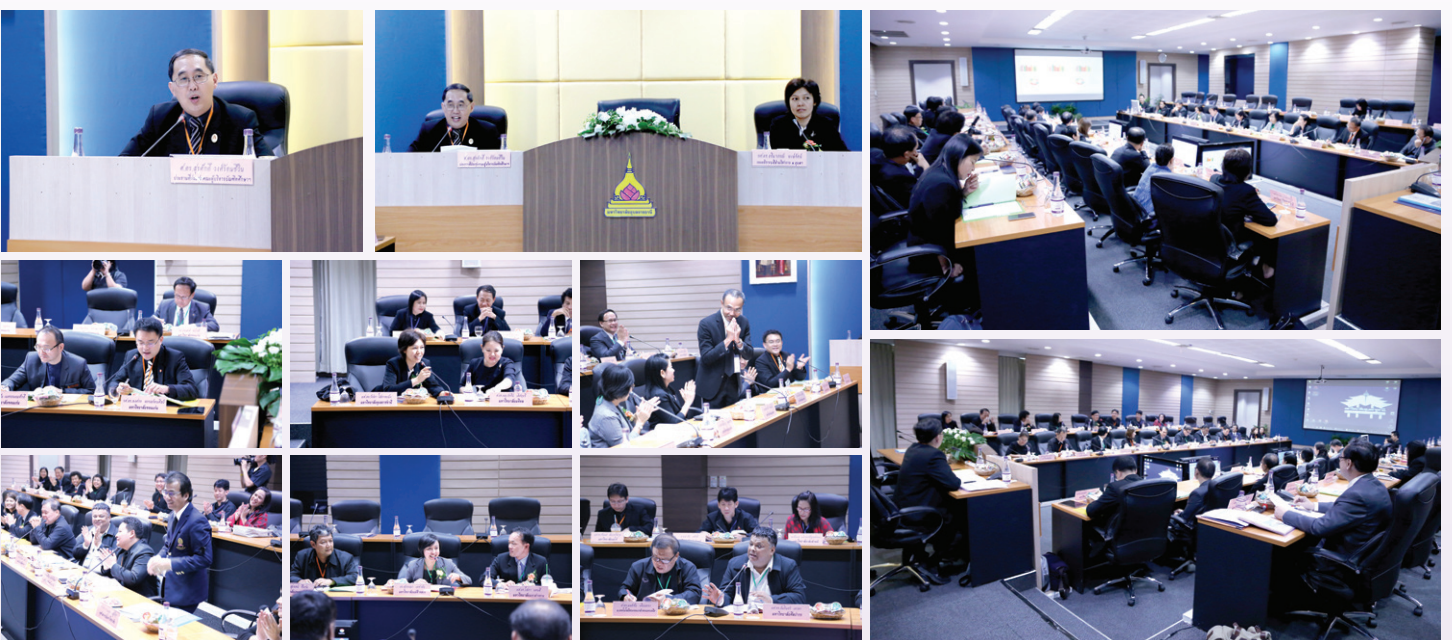
บรรยายภาคการประชุมคณะผู้บริหารบัณฑิตศึกษา มหาวิทยาลัยของรัฐและมหาวิทยาลัยในกำกับของรัฐ (ทคปร.) ครั้งที่ 3/2560 วันพฤหัสบดีที่ 19 ตุลาคม 2560 ณ ห้องประชุมวารินชำราบ มหาวิทยาลัยอุบลราชธานี