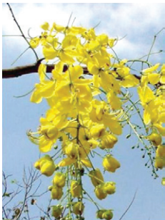
ต้นราชพฤกษ์