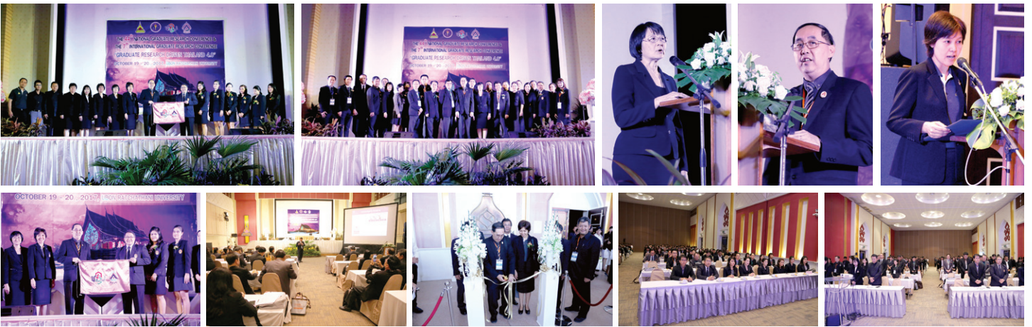
บรรยายภาคการประชุมนิเทศการเสนอผลงานวิจัยระดับบัณฑิตศึกษาแห่งชาติ ครั้งที่ 44 และการประชุมนิเทศการเสนอผลงานวิจัยระดับบัณฑิตศึกษานานาชาติ ครั้งที่ 7 วันที่ 19-20 ตุลาคม 2560 ณ มหาวิทยาลัยอุบลราชธานี จังหวัดอุบลราชธานี