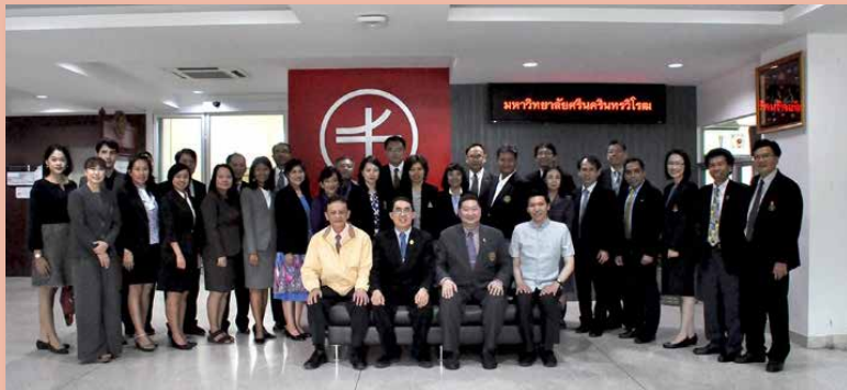
คณะผู้บริหารบัณฑิตศึกษา มหาวิทยาลัยของรัฐและมหาวิทยาลัยในกำกับของรัฐ (ทคปร.) ถ่ายภาพที่ระลึกร่วมกัน

การประชุมคณะผู้บริหารบัณฑิตศึกษา มหาวิทยาลัยของรัฐและมหาวิทยาลัยในกำกับของรัฐ (ทคปร.) ครั้งที่ 4/2560 วันศุกร์ที่ 8 ธันวาคม 2560 ณ ห้องประชุมมิตรธรรม มหาวิทยาลัยศรีนครินทรวิโรฒ องครักษ์ จังหวัดนครนายก