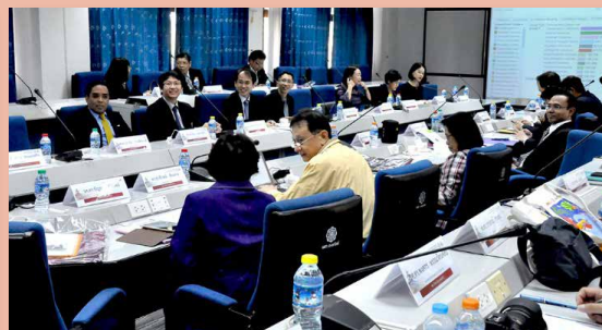
บรรยากาศการประชุมคณะผู้บริหารบัณฑิตศึกษามหาวิทยาลัยของรัฐ และมหาวิทยาลัยในกำกับของรัฐ (ทคปร.) ณ มหาวิทยาลัยศรีนครินทรวิโรฒ องครักษ์