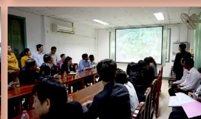
การประชุมคณะผู้บริหารบัณฑิตศึกษามหาวิทยาลัยของรัฐและมหาวิทยาลัยในกำกับของรัฐ (ทคปร.) กิจกรรมแสวงหาความร่วมมือทางวิชาการและแลกเปลี่ยนการจัดการศึกษา ณ ประเทศกัมพูชา