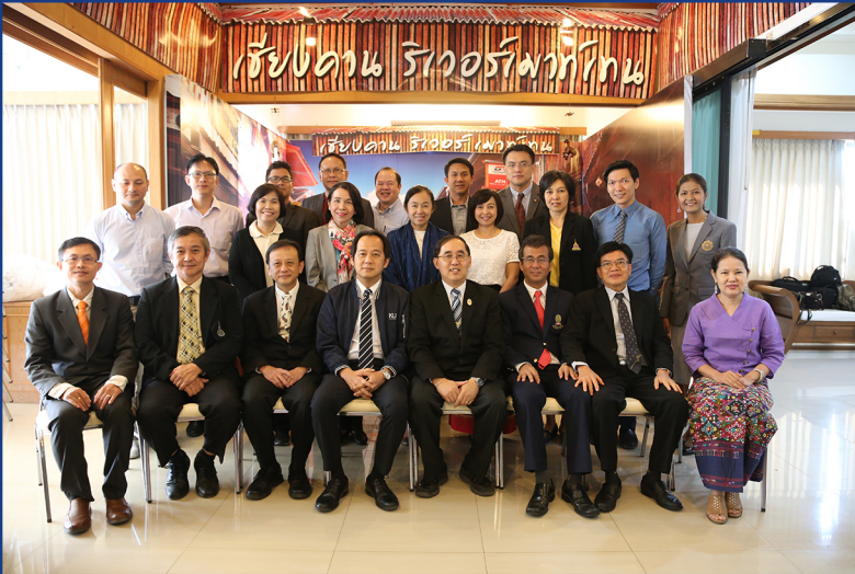
คณะกรรมการบริหารบัณฑิตศึกษา มหาวิทยาลัยของรัฐและมหาวิทยาลัย ในกำกับของรัฐ (ทคปร.) ถ่ายภาพที่ระลึกร่วมกัน

ที่ประชุมคณะกรรมการบริหารบัณฑิตศึกษา มหาวิทยาลัยของรัฐและมหาวิทยาลัยในกำกับของรัฐ (ทคปร.) ครั้งที่ 3/2561 วันศุกร์ที่ 2 พฤศจิกายน พ.ศ. 2561 ณ โรงแรมเชียงคานริเวอร์ เมาท์เทน อำเภอเชียงคาน จังหวัดเลย (บัณฑิตวิทยาลัย มหาวิทยาลัยขอนแก่น เป็นเจ้าภาพจัดการประชุม)