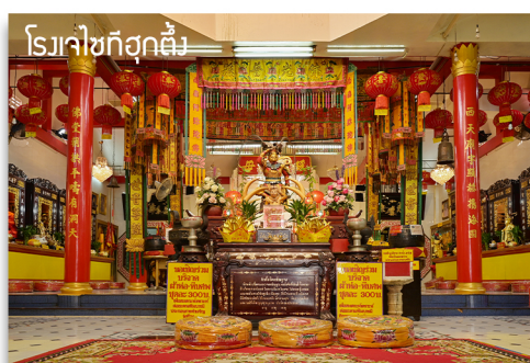
โรมา์ชี่ทอ์กัฒ์