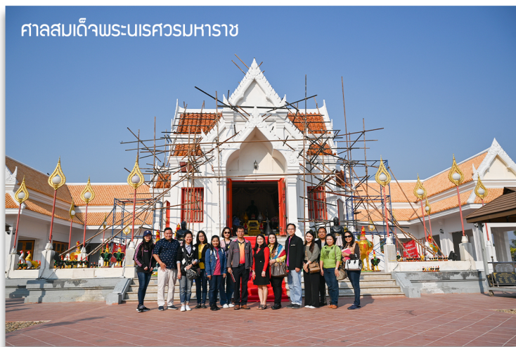
ศาลสมเด็จพระนเรศวรมหาราช