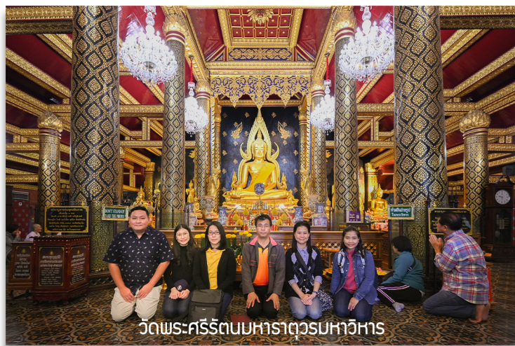
วัดพระศรีรัตนมหาธาตุวรมหาวิหาร