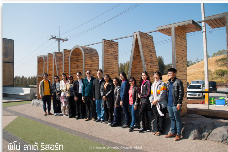
พื้ด ลาดี่ รี่สรอ์