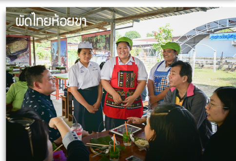
พื้ดไทยห้อยขา