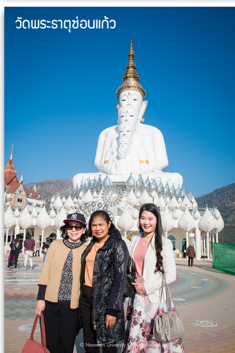
วัดพระธาตุช่อแก้ว