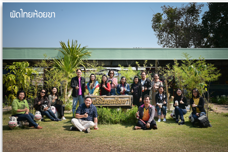
พื้ดไทยห้อยขา