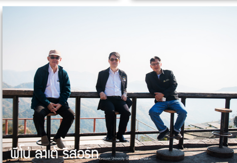
พื้ด ลาดี่ รี่สรอ์