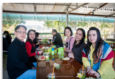
พื้ดไทยห้อยขา