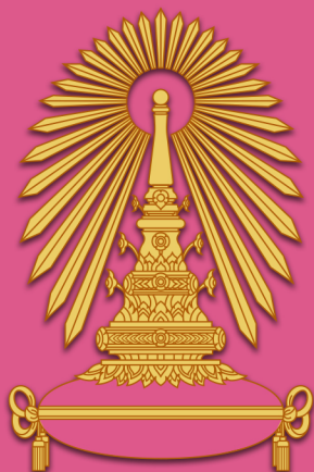
พระเกี้ยว