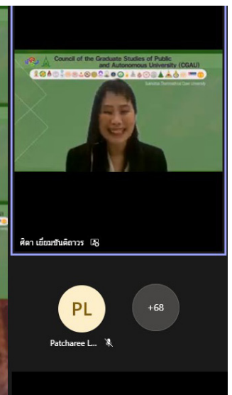
ศิตา เข็มอินทิฉฉฉฉฉ